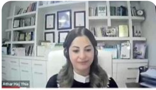
"אחד עם אחד 3" - הסכת 119 - עם ד"ר אתאר חאג' יחיא מהמכללה האקדמית בית ברל

مشاركة المحاضرة والباحثة الدكتورة أثارحاج يحيى في برنامج "واحد مع واحد" مع بروفييسور عوفر عتسيون في القناة الرقمية لكلية صفد الأكاديمية. وقد تحدثت فيها عن منظومة التعليم العربي في إسرائيل بشكل عام، وعن تدريس اللغة العربية والتعددية اللغوية بشكل خاص. رابط اللقاء